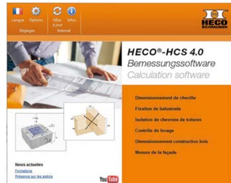
HECO_logiciel HCS 4.0.jpg

L'ensemble de la gamme des vis HECO, vis à bois et à béton, sera présenté sur le stand marque au salon EUROBOIS.